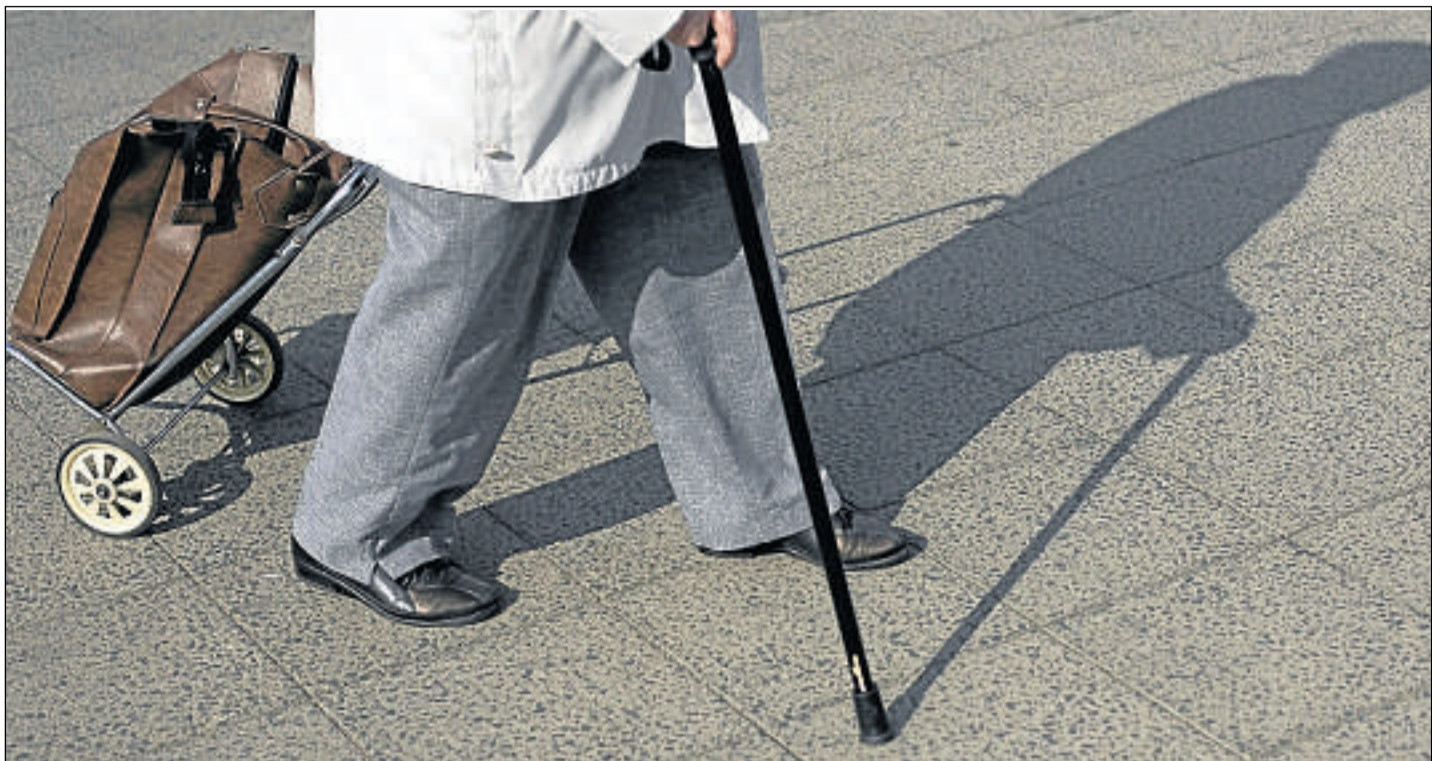
Der Schatten des Wandels eilt voraus: In einem Jahrzehnt ist jeder zweite Hersfelder über 50 Jahre alt, sagen die Prognosen.